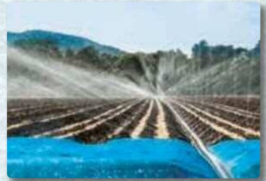
灌水 (諫早市飯盛町)

人々の暮らしや自然風景に溶け込んでいる土地改良施設 (田畑のほ場整備、農業用水路、農道、頭首工、ファームポンド、水管橋、揚水機場、排水機場、水門、歴史遺産など) 及び施設の保全活動などの写真