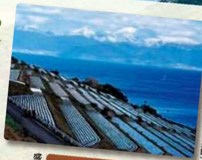
新年のジャガイモ畑 (諫早市飯盛町)