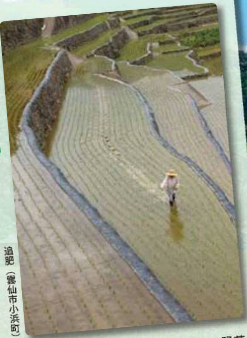
追肥 (雲仙市小浜町)

農作業風景 (代掻き、田植え、稲刈り、野菜作り、果樹の手入れ、収穫など) や農業体験 (農作業体験、収穫イベントなど) 等の写真