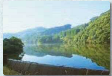
朝霧のため池 (諫早市長野町)