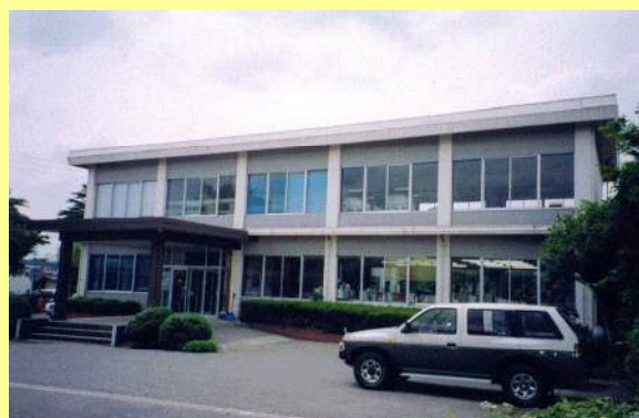
【土地改良区事務所の新增築に】