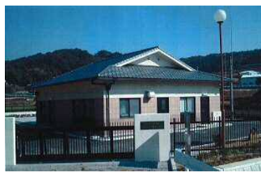
農業集落排水処理施設(外観)

農業集落排水事業は、農村地域における資源循環の促進を図りつつ、農業用排水の水質保全及び農業用排水施設の機能維持又は農村生活環境の改善を図ることを目的として、し尿、生活雑排水等の汚水や汚泥、雨水を処理する施設若しくはこれらの循環利用を目的とした施設の整備改修を行うものです。 農業基盤整備資金は、農業集落排水事業として実施する浄化槽の設置、各家庭までの排水管敷設工事、更にはトイレ、浴室、洗面所の改修等、国の補助対象にならない部分に係る工事費用に対し、有利な借入条件で利用頂ける制度資金です。