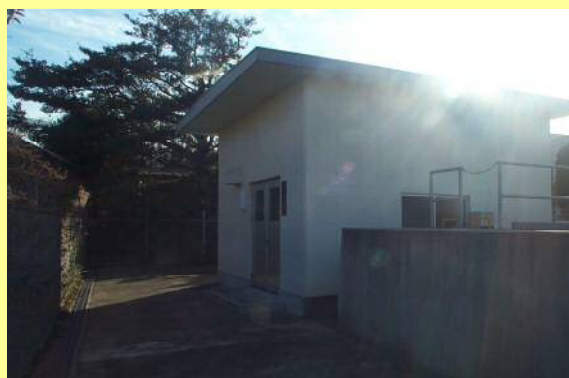
【管理施設の整備補修に】

土地改良施設に係る維持管理（整備補修）に対しては、国の補助事業により一定の助成が行われており、事業に必要な経費のうち、国等の補助金以外の受益者が負担する部分（分担金といいます。）については、農業基盤整備資金の融資対象となっています。また、土地改良区等が国の補助を受けないで行う土地改良施設の整備補修についても幅広く農業基盤整備資金の融資対象としているほか、土地改良区の事務所建設に要する費用や事務機器、巡回用車両の購入等についても、融資を受けることができます。