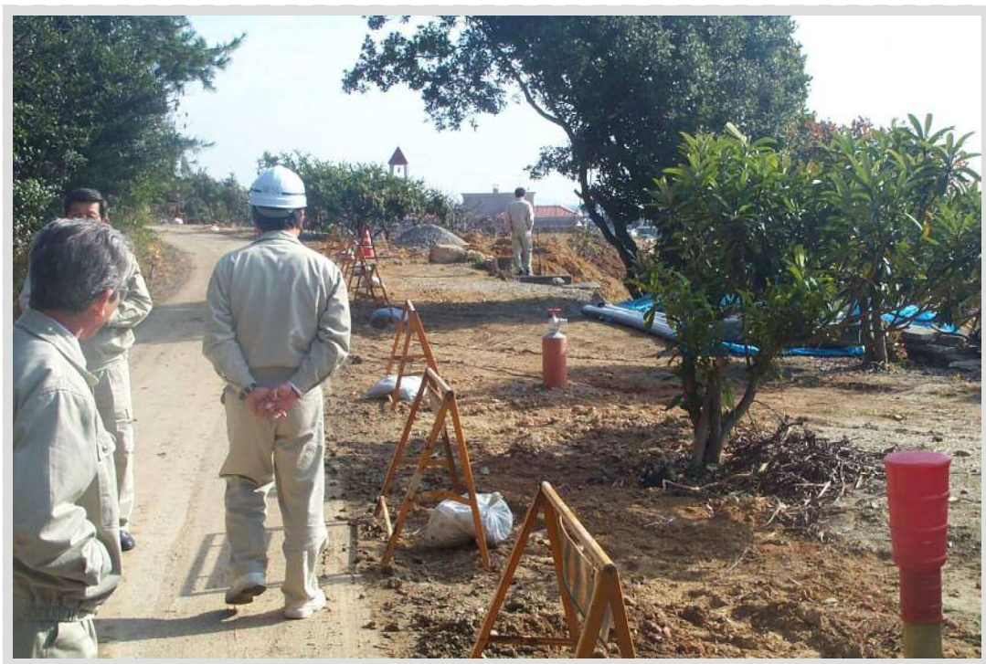
パイプラインの補修作業

農業基盤整備資金は、土地改良区などが行う土地改良施設の維持管理事業に対して、用排水路や農道などの補修は勿論のこと、土地改良区の事務所の建設、事務機器や巡回用車両等の購入など、維持管理事業のあらゆる用途に幅広くご利用頂けます。