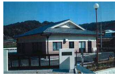
農業集落排水処理施設(外観)

農業集落排水事業は、農村地域における資源循環の促進を図りつつ、農業用排水の水質保全及び農業用排水施設の機能維持又は農村生活環境の改善を図ることを目的として、し尿、生活雑排水等の汚水や汚泥、雨水を処理する施設若しくはこれらの循環利用を目的とした施設の整備改修を行うものです。 農業基盤整備資金は、農業集落排水事業として実施する浄化槽の設置、各家庭までの排水管敷設工事、更にはトイレ、浴室、洗面所の改修等、国の補助対象にならない部分に係る工事費用に対し、有利な借入条件で利用頂ける制度資金です。