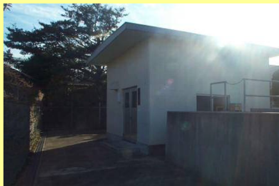
【管理施設の整備補修に】

土地改良施設に係る維持管理（整備補修）に対しては、国の補助事業により一定の助成が行われており、事業に必要な経費のうち、国等の補助金以外の受益者が負担する部分（分担金といいます。）については、農業基盤整備資金の融資対象となっています。また、土地改良区等が国の補助を受けないで行う土地改良施設の整備補修についても幅広く農業基盤整備資金の融資対象としているほか、土地改良区の事務所建設に要する費用や事務機器、巡回用車両の購入等についても、融資を受けることができます。