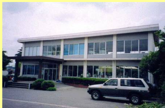
【土地改良区事務所の新增築に】