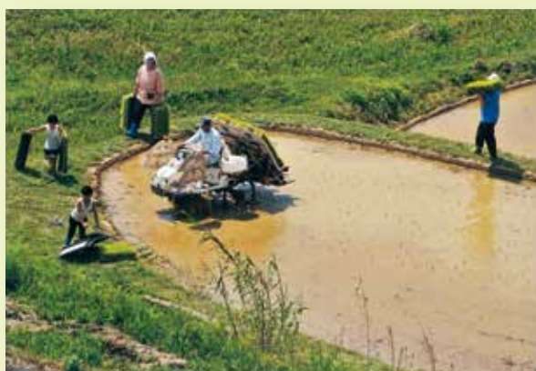
ファミリー田植え