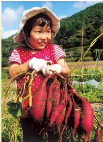
「大きなオイモ取れたよ！」